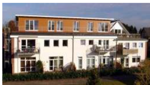
Penthouse 121.000,- € 84 m 2 2-3 Zi, Terrasse